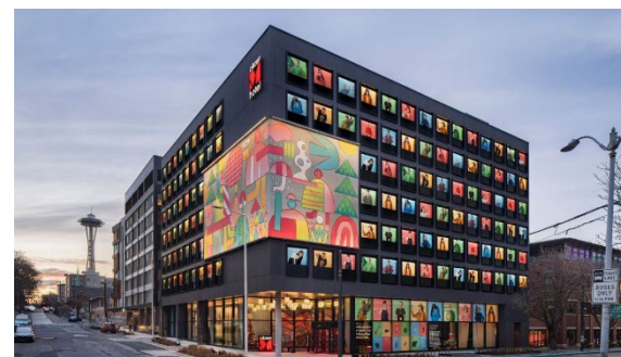
Figuur 1 - citizenM

Daarnaast benadrukt Marr dat Agentic AI de kracht heeft om niet alleen informatie te genereren, maar ook autonoom beslissingen te nemen en doelen na te streven. Dit opent de deur voor AI-systemen die zelfstandig boekingen, prijsstrategieën en gastervaringen optimaliseren zonder directe menselijke tussenkomst.