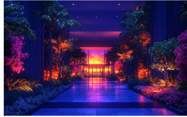
Figuur 2 - Hilton.

Deze eerste voorbeelden laten zien hoe AI hospitalitybedrijven helpt om operationele efficiëntie te verhogen en klanttevredenheid te verbeteren.